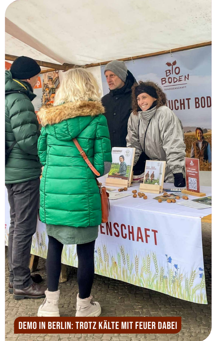
DEMO IN BERLIN: TROTZ KÄLTE MIT FEUER DABEI