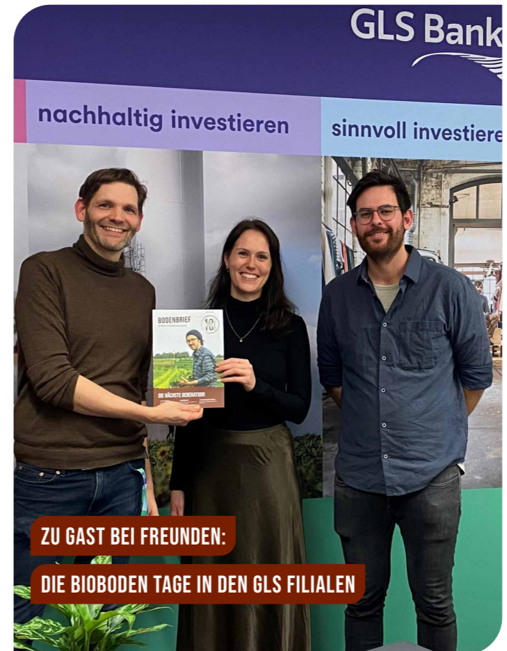
ZU GAST BEI FREUNDEN: DIE BIOBODEN TAGE IN DEN GLS FILIALEN

Im Januar dieses Jahres waren wir bereits bei der Demonstration „Wir haben es satt“ in Berlin, auf der sich 8.000 Menschen und Dutzende Traktoren über die Straßen der Hauptstadt bewegten, um sich lautstark für eine zukunftsfähige Landwirtschaft weltweit einzusetzen. Wir haben uns mit einem Infostand engagiert, an dem wir viele unserer Mitglieder getroffen haben – es waren wichtige und schöne Begegnungen.