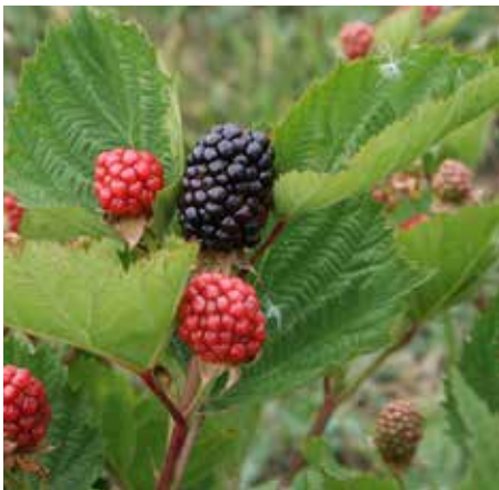
Demeter-Beeren von Bauernhof Weggun

Wer erklären will, wie BioBoden Flächen sichert, kann es sich ganz einfach machen. Das klingt dann ungefähr so: Die Genossenschaft kauft Flächen und verpachtet sie an Bio-Landwirte. Fertig. Doch leider ist es wie im echten Leben: Es ist viel bunter und komplexer, als man annimmt. Greifen wir also zur Lupe und schauen genau hin: Wie macht BioBoden das?