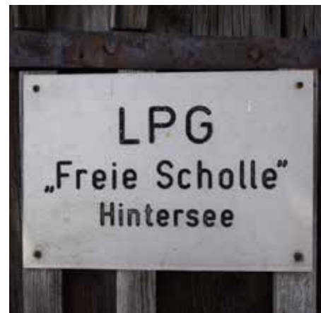
Der damalige Hofname

zur Qualitätsentwicklung ist nun der Wechsel des Öko-Anbauverbands von Biopark zum strengeren Bioland.“