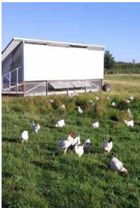
Das Hühnermobil im Land Brandenburg