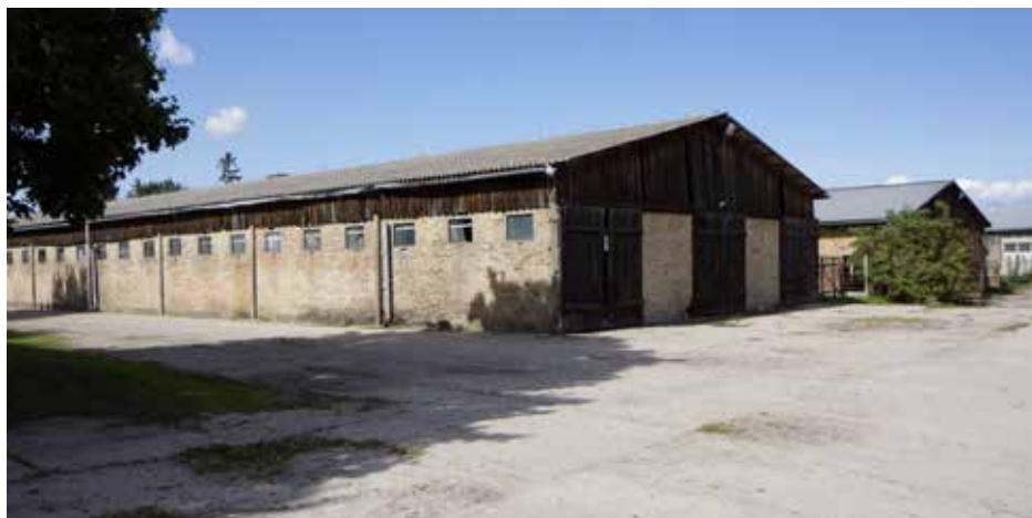
Früher war das Landgut Seegrund eine große Landwirtschaftliche Produktionsgesellschaft der DDR

Dieses Beispiel zeigt: Ein ganzer Hofkauf kann unter Umständen deutlich wirkungsvoller sein, als nur einzelne Grundstücke zu sichern. Denn dem ehemaligen Eigentümer gehörten „nur“ 230 Hektar der insgesamt bewirtschafteten 600 Hektar. Mit dem Erwerb des ganzen Hofes werden aber auch die restlichen vom Hof gepachteten Grundstücke von etwa 370 Hektar weiter ökologisch bewirtschaftet. Durch die Übernahme des gesamten Betriebs hat BioBoden also – übrigens mit fast der gleichen Geldsumme – weit mehr als das Doppelte der ursprünglichen Eigentumsfläche gesichert. Greff: „Besser kann es manchmal nicht laufen.“