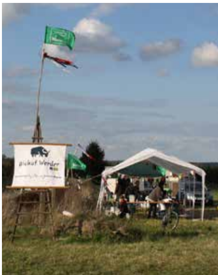
Zum Baublütenfest auf dem Biohof Werder

Diese und weitere Porträts finden Sie auch auf www.bioboden.de/partnerhoeft