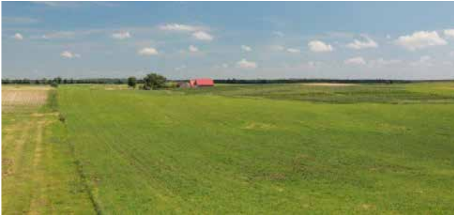
Bauernhof Weggun: Insel in einem konventionellen Meer

BioBoden hat das Ziel, Flächen für den ökologischen Landbau zu sichern. Das klingt erst einmal gut, aber wie funktioniert das eigentlich?